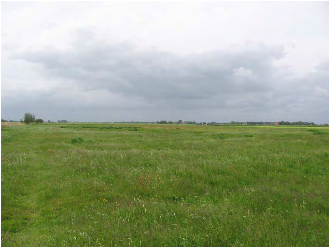
Structuurrijk, maar bloemarm maaidatumland