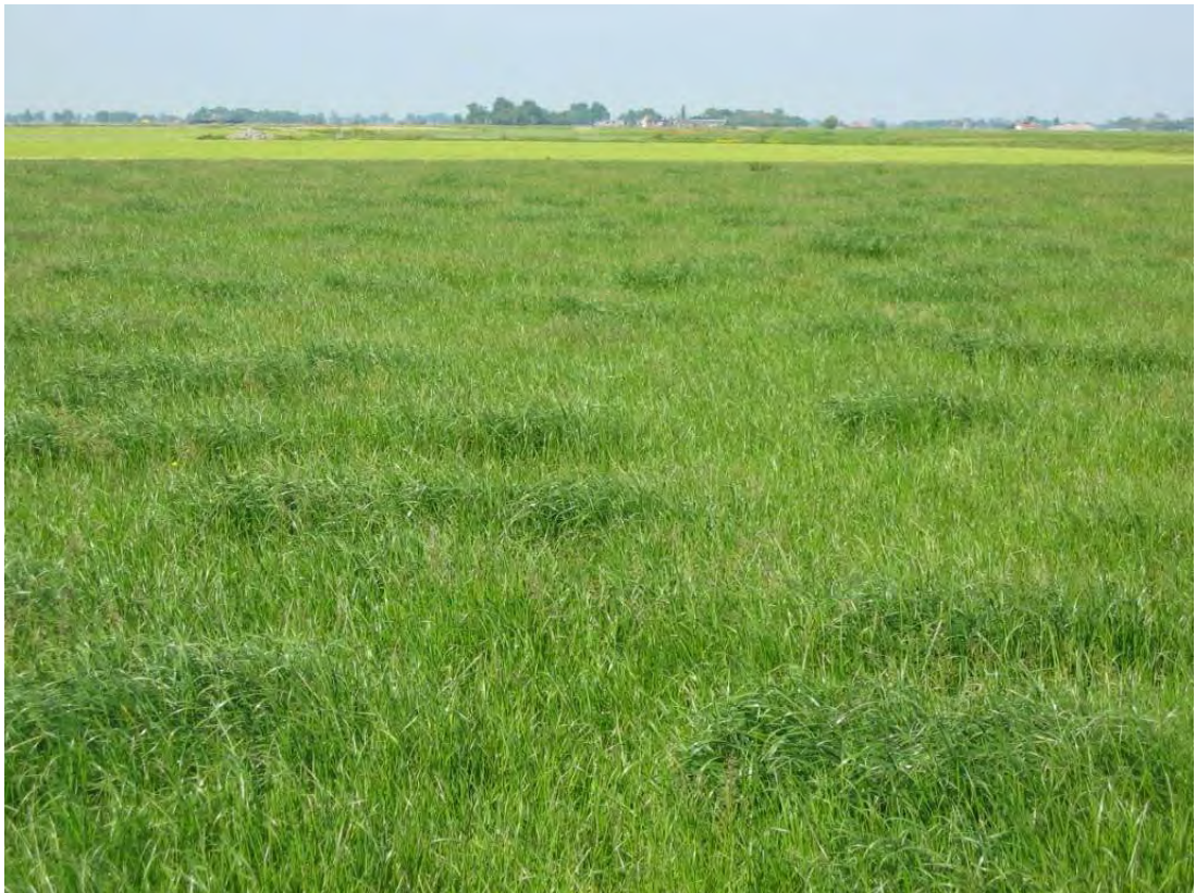
Voorgeweid grasland met gevarieerde structuur