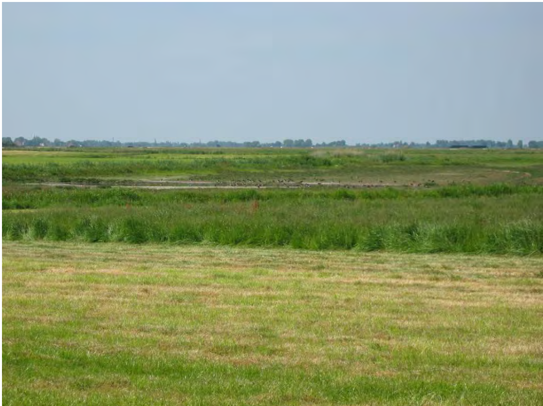
Permanente plasdras in een weidevogelgebied trekt veel vogels

Een succesvolle maatregel met het inrichten van plasdras is het zogenaamde landje van Geysel bij Amstelveen. Dit is een oppervlakte van 9 ha grasland, waarop plasdras is gecreëerd temidden van autowegen in een hoek van het weidevogelpolder Ronde Hoep. De vergoeding komt uit de Subsidieregeling Agrarisch Natuurbeheer. Jaarlijks zitten er in het vroege voorjaar talloze doortrekkende steltlopers, eenden en reigers, waaronder duizenden Grutto's, die van daaruit geleidelijk de omringende graslanden bevolken om te broeden.