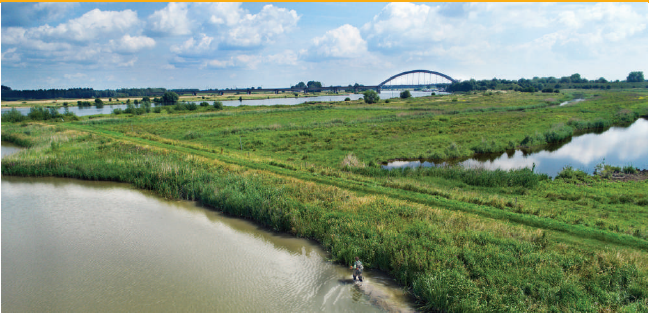
Het is mogelijk de muskusrat effectief te bestrijden, ook in het Nederlands rivierenlandschap.

Op grond van theorie en praktijk is aantoonbaar dat aantallen muskusratten inderdaad tot nul kunnen worden teruggebracht. Uit Engeland, Vlaanderen en op lokale schaal ook in Nederland (zie kaart) zijn daar voorbeelden van. De directe kosten van de strategie ‘terugdringen tot de landsgrens’ zijn niet belemmerend. Sterker, er ligt een besparing in het verschiet ten opzichte van de verwachte jaarlijkse kosten onder de huidige doelstelling. De negatieve effecten zijn verwaarloosbaar.