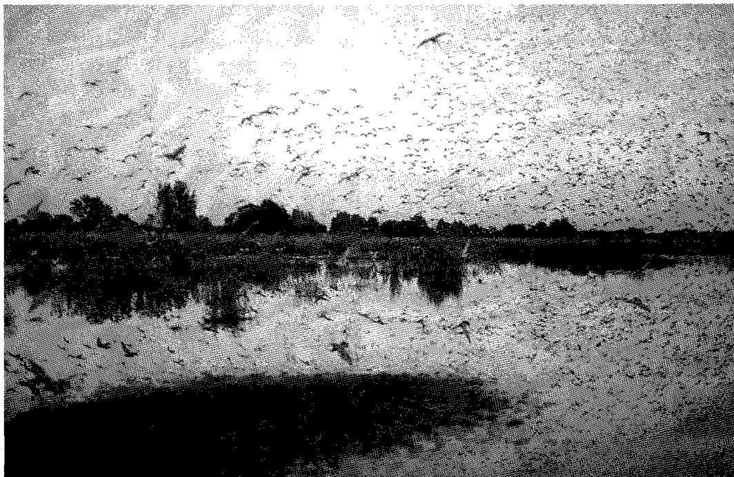
Grutto's op slaappleats, Lytse Saiterpolder de Alde Feanen (Benny Klazenga) Roosting Black-tailed Godwits Limosa limosa

activiteiten in het voorjaar van 1993 in Friesland hebben geleid tot een sterk verlaagd broedsucces van de Grutto. Vooral het feit dat in 1-2 twee weken tijd in de eerste helft van mei bijna alle graslanden waren gemaaid is daarbij van belang geweest. Er zijn dan nauwelijks ontsnappingsmogelijkheden. Daar komt nog bij, dat door de snelle grasgroei in de tweede helft van april nesten van Grutto's door vogelwachters moeilijk gevonden konden worden, waardoor maar relatief weinig nesten in het kader van de nazorg konden worden gemarkeerd (Hoekstra 1994).