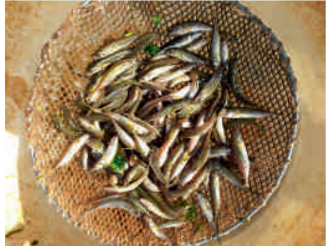
Links vissen uit de paaibiotop, rechts tiendoornige stekelbaarsjes uit de vloeienvijvers.

(58 tot 77 procent) van de aantallen vis. Het percentage van de aangetroffen soorten dat hier paait, varieert van jaar tot jaar van 71 (in 2008) tot 100 (in 2011). Brasem, paling en kleine modderkruiper zijn de enige hier niet-paaiende soorten.